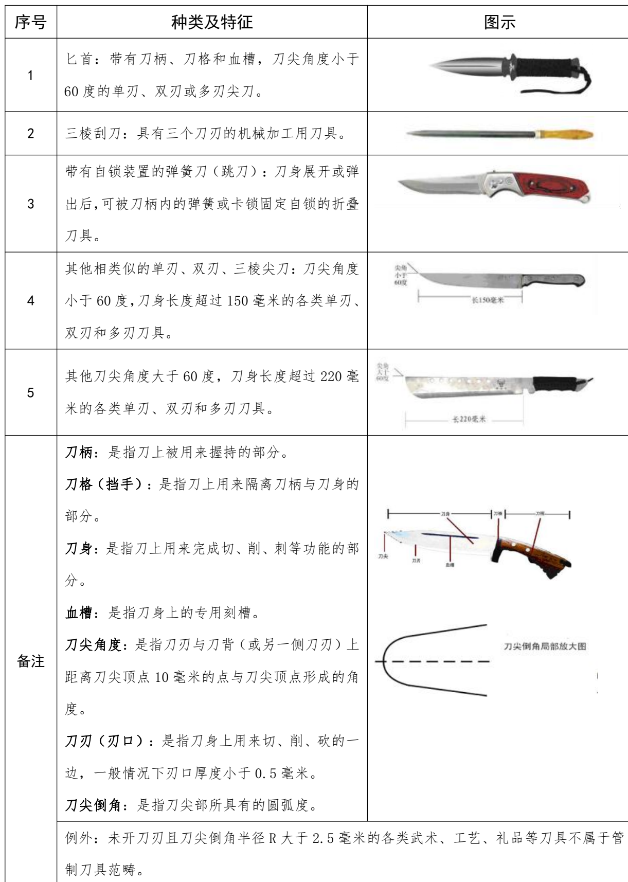
附件 3：常见管制刀具种类及特征和图示